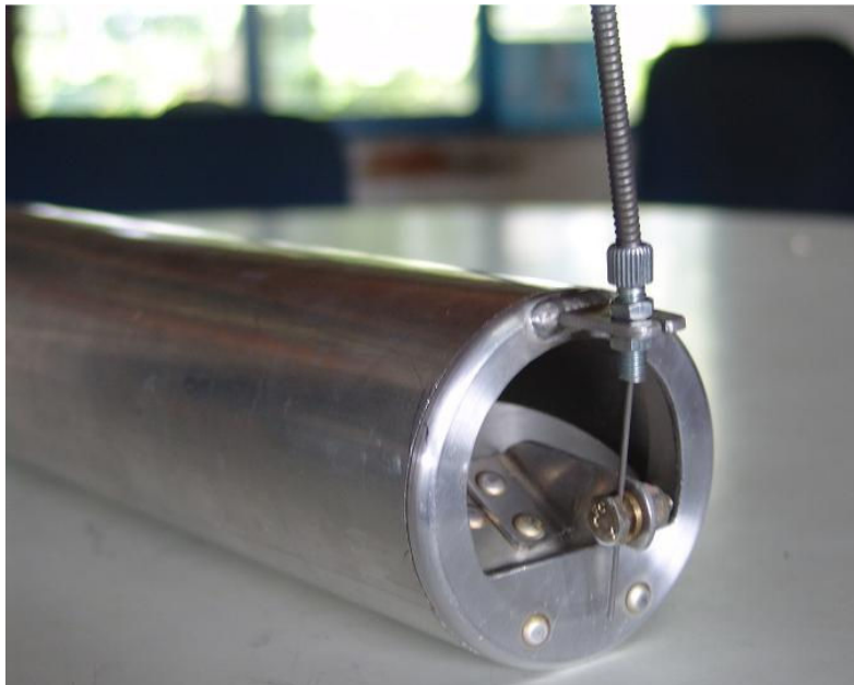
Ventanilla de Entrada de Aire “Abierta”. Configuración Normalmente Aspirado

Una vez soldada la ventanilla de entrada de aire manual al tarro balance del sistema Turbo (Airbox) y posicionada la guaya en la ventanilla y adaptada al interior de la cabina, esta lista para ser operada.