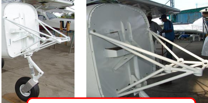
BANCADA TIPO IBIS ANTERIOR A LA FECHA

INSTRUCCIÓN. Modificación de la bancada tipo IBIS para aviones posteriores a la fecha de publicación.