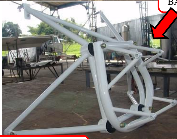
BANCADA TIPO IBIS POSTERIOR A LA FECHA